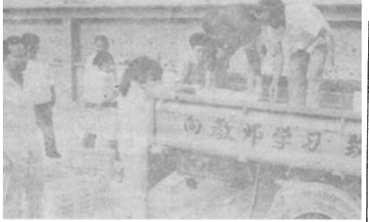
市东城粮店积极开展“迎亚运优质服务活动”。他们制订了一系列措施，改善服务态度，提高服务质量，增添服务项目。图为粮店职工为教师们登门送食品。

如果说，照料老人是王金荣的本职工作，天天住在敬老院是应该的话，那么，逢年过节回到家中也该是情理之中了。因为她有一个幸福和睦的家庭，家里有儿孙一大帮。每逢节日，儿子、儿媳妇们等着她，孙子、孙女们盼着她，等着她、盼着她回家团圆。然而，四年中的元宵节、八月节、元旦、春节她全都和老人们团圆在敬老院里。她说：“节日他们更需要有人陪伴。”（袁井泉）